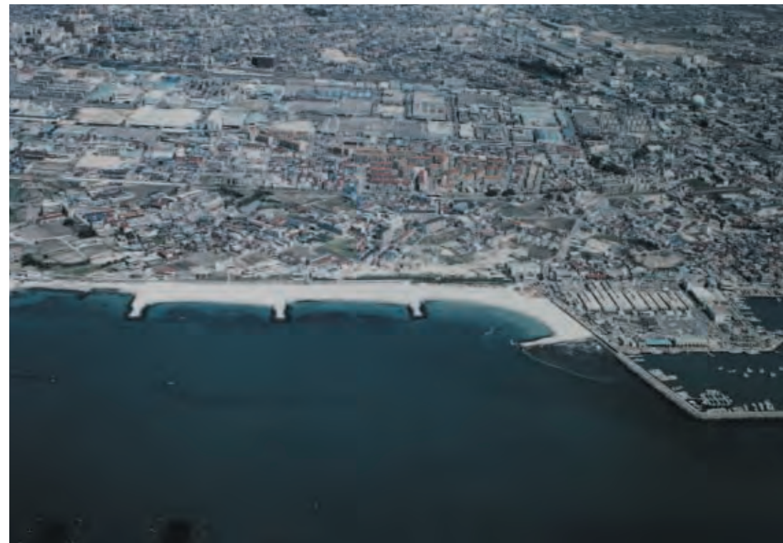
<養浜施工状況 松江～藤江>