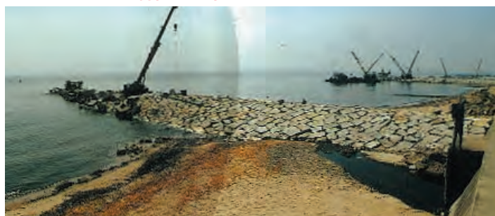
<昭和58年> 突堤被覆石の表面均し状況