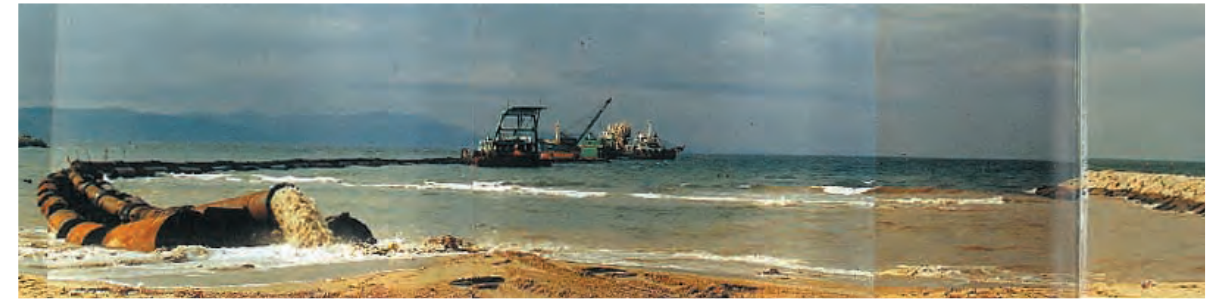
<昭和59年 松江地先> バージアンローダー船による養浜砂の吹き上げ