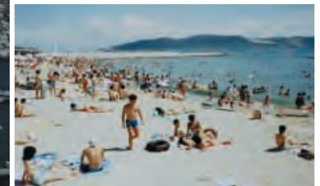
海水浴客に利用される養浜