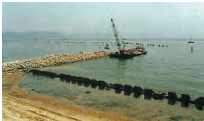
<昭和58年> 突堤中詰捨石捨込状況