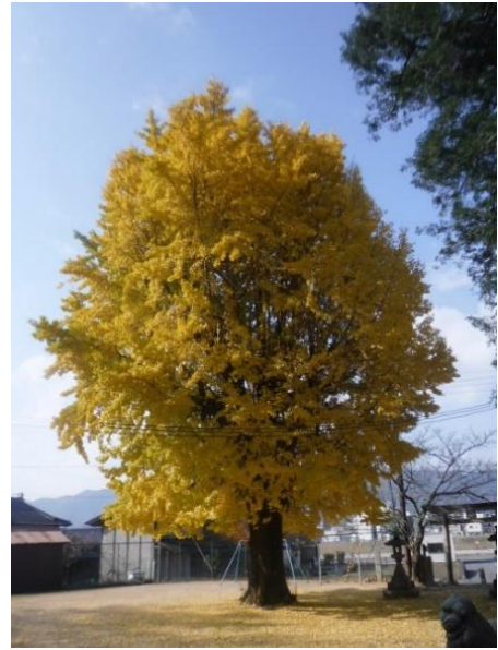
④ひちりき神社 境内の大イチョウは、この時期、黄色の絨毯に！