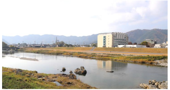
①せせらぎ公園 かつて高瀬舟の発着場があったところは親水公園として整備されている