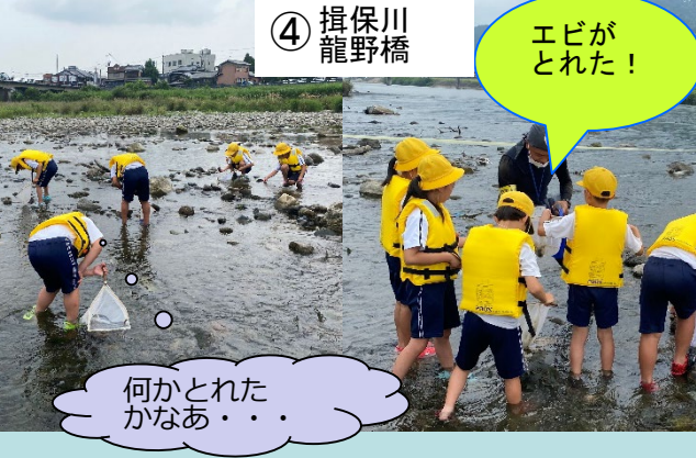
④ 揖保川 龍野橋