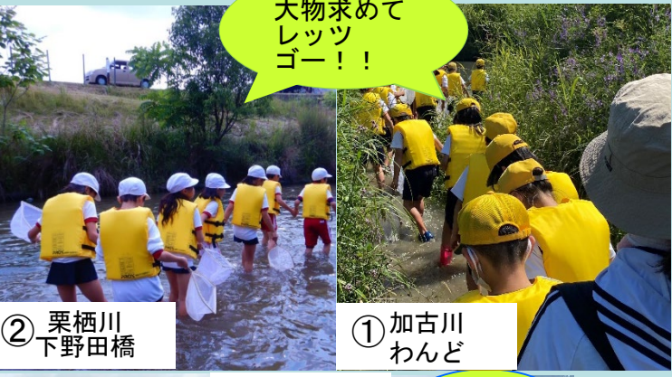
② 栗栖川 下野田橋