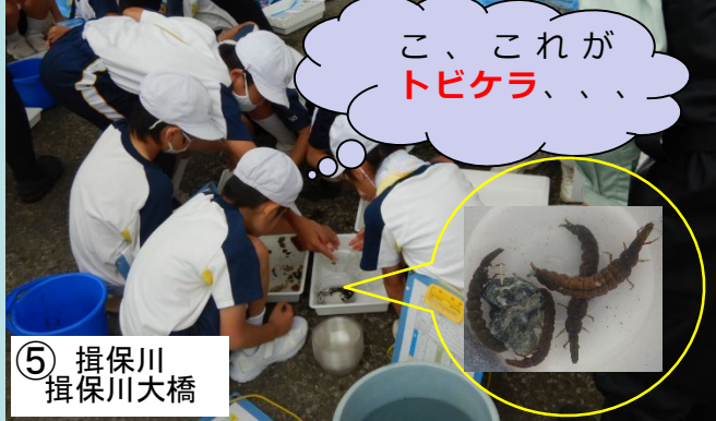
⑤ 揖保川 揖保川大橋