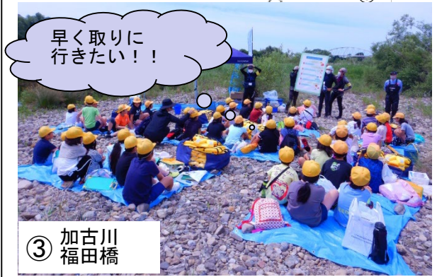
③ 加古川 福田橋