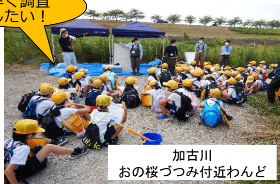
加古川 おの桜づつみ付近わんど