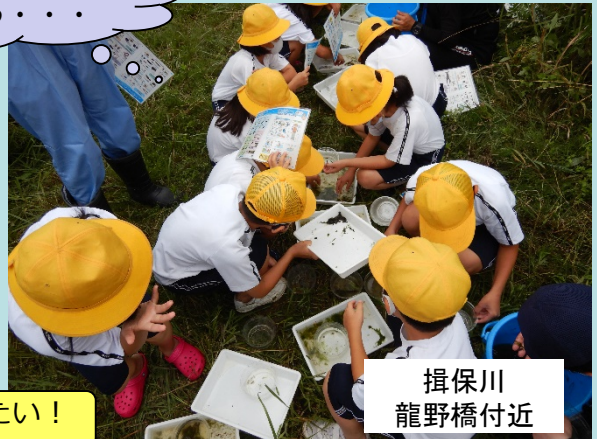
揖保川 龍野橋付近