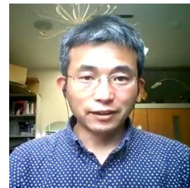
兵庫県立大学大学院 准教授 澤田委員