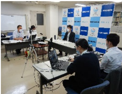
姫路河川国道事務所 会議中の様子