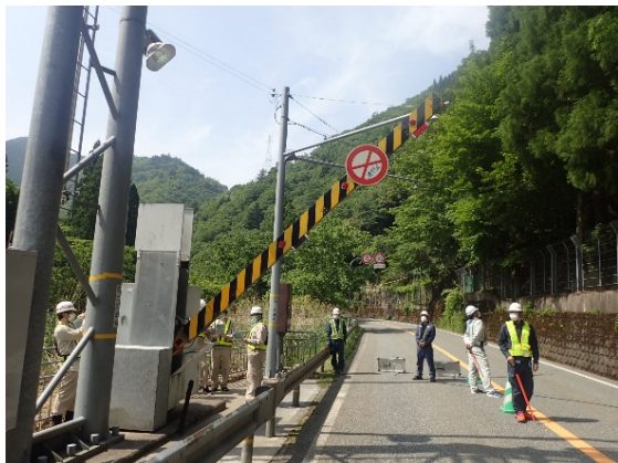
▲遮断機の操作訓練状況