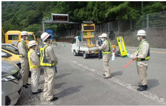
▲通行規制について説明