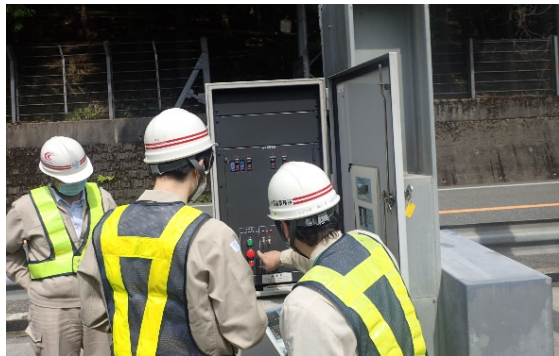
▲遮断機の操作について説明