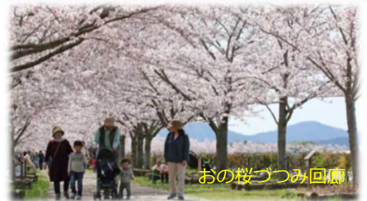
おの桜つつみ回廊

川の怖さや対応について学びつつ、昔気軽に川と親しみ、身近に感じられていた時代(昭和30～40年代)への回帰をイメージしながら、川の多様な景観や憩いの場、自然や歴史の学びの場としてかわがまちとつながる場をみんなで作っていく。