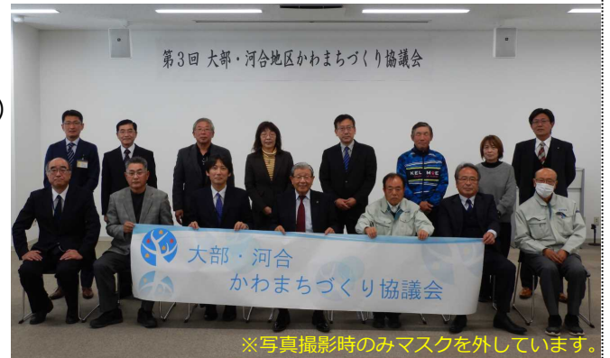
※写真撮影時のみマスクを外しています。