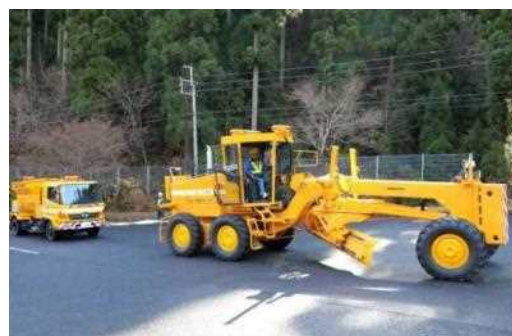
牽引による車両移動の様子