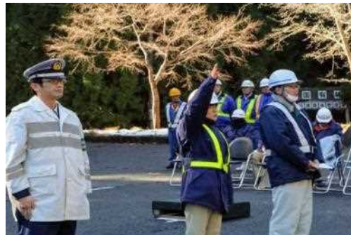
担当者による宣誓