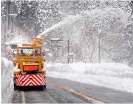
ロータリ除雪車による除雪(後ろから)