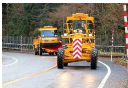
出動する除雪グレーダーと除雪トラック