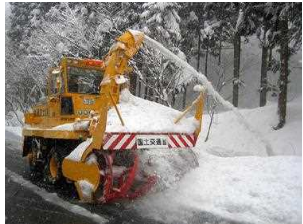
ロータリ除雪車による除雪(前から)