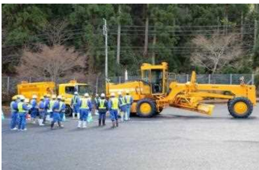
車両移動訓練の説明