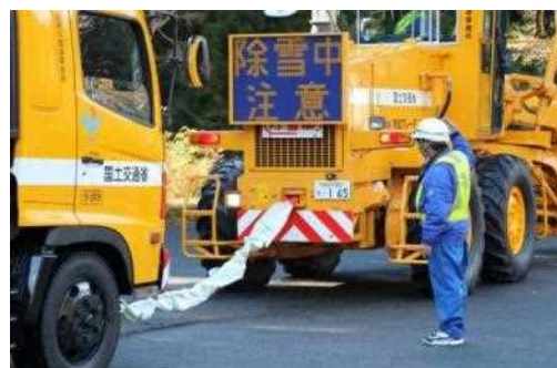
車両に牽引ロープを装着