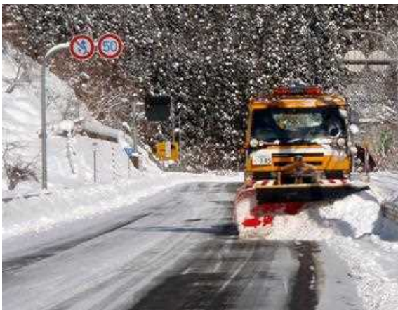
除雪トラックによる除雪(前から)