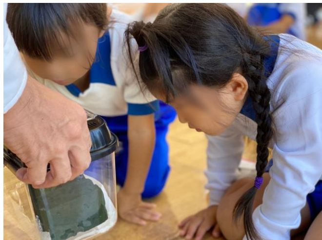
フジバカマの種に興味津々