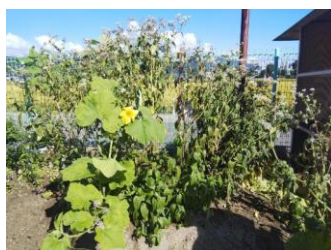
白い花を咲かせて満開となったフジバカマ