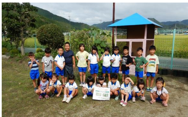
フジバカマを育ててくれた園児たち