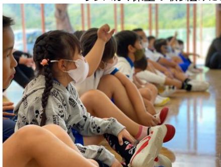
熱心に話を聞く園児の様子