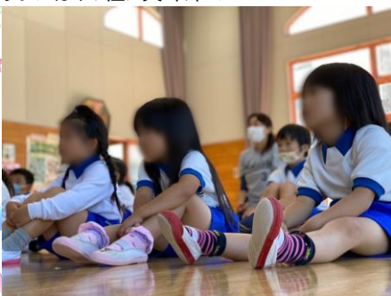
熱心に話を聞く園児の様子

観察会では、かつて揖保川に多く生息していたフジバカマについて説明し、自然環境保全の大切さを学んで頂きました。