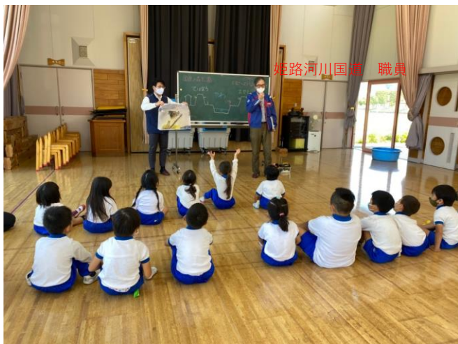
フジバカマ保全の取り組みについて説明