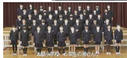
大観小学校 6年生の皆さん

まちづくり大観地区協議会会長や、地元の小中学生より感謝と期待のお言葉を頂きました。