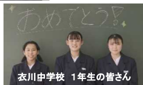
衣川中学校 1年生の皆さん