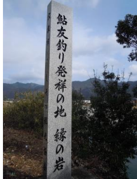
鮎友釣り発祥の地