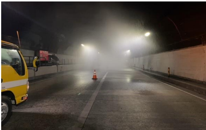
▲ 放水中の様子。 先が見えなくなるほどの水を放水しています。