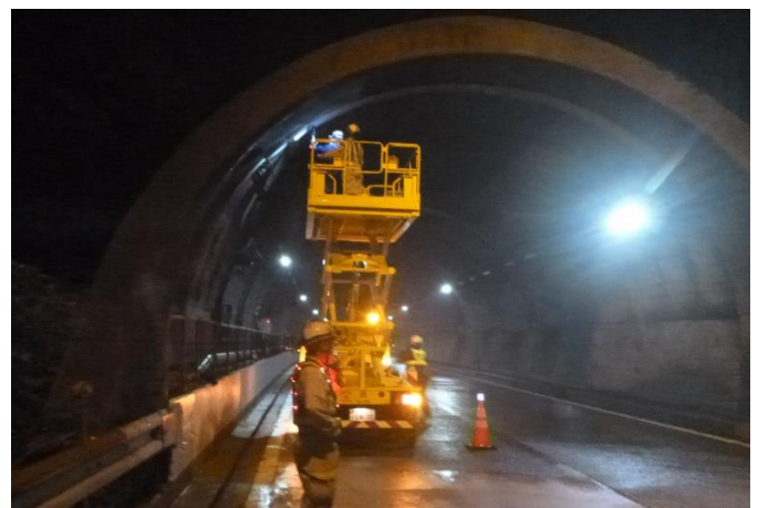
▲ 放水後にトンネル上部に設置された放水設備の点検を行います