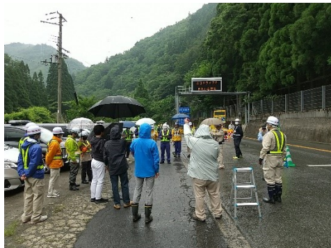
▲当日は、NHK(6/7(水) 17時30分放送)の取材及び読売新聞(6/8(木)掲載)の取材がありました。