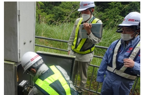
▲ウェアラブルカメラを使用して訓練の様子を事務所に配信しています。