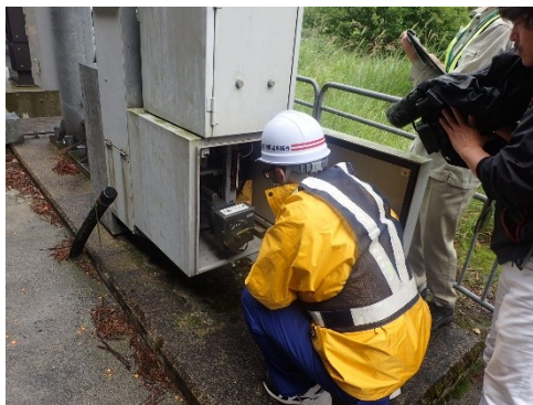
▲手動でも遮断機を下ろすことは出来ます。万が一に備え手動での操作も実施しました。