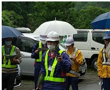
▲実際に無線機を使用して通信相手と話し、無線機の操作方法を確認しました。