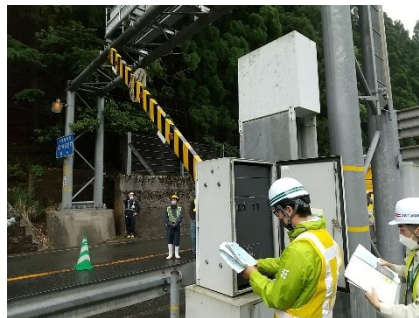
▲遮断機の操作を行いました。梅雨の大雨や台風への備えは着々と進んでいます。