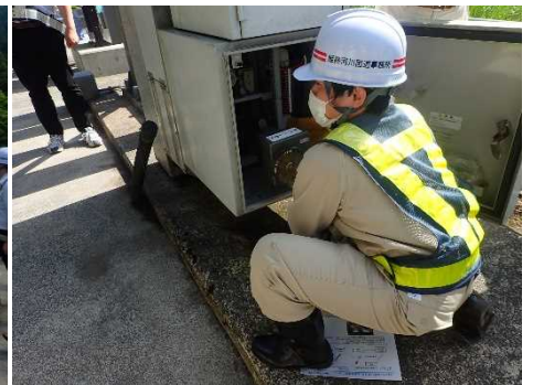
▲遮断機の操作説明の様子(手動操作)