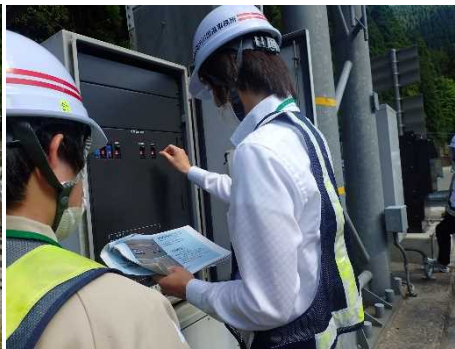
▲遮断機の操作説明の様子(電動操作)