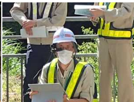
▲ウェアラブルカメラ中継の様子