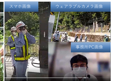
▲事務所との共有状況 (Teams会議)