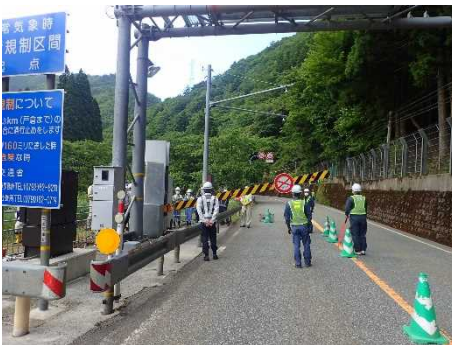
▲訓練中の規制状況