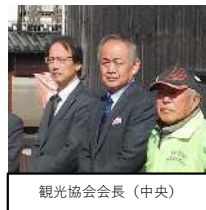
観光協会会長(中央)