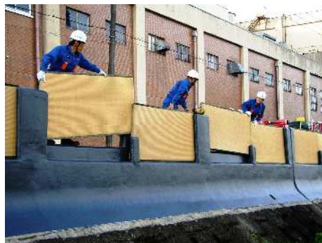
畳堤へ畳を設置している様子