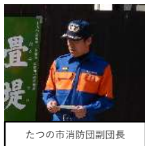
たつの市消防団副団長