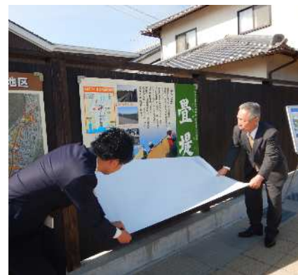
畳堤看板お披露目の様子