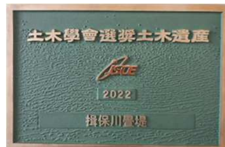
土木学会より授与された銘板