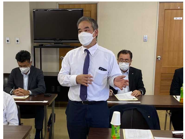
三木姫路支部長によるあいさつ