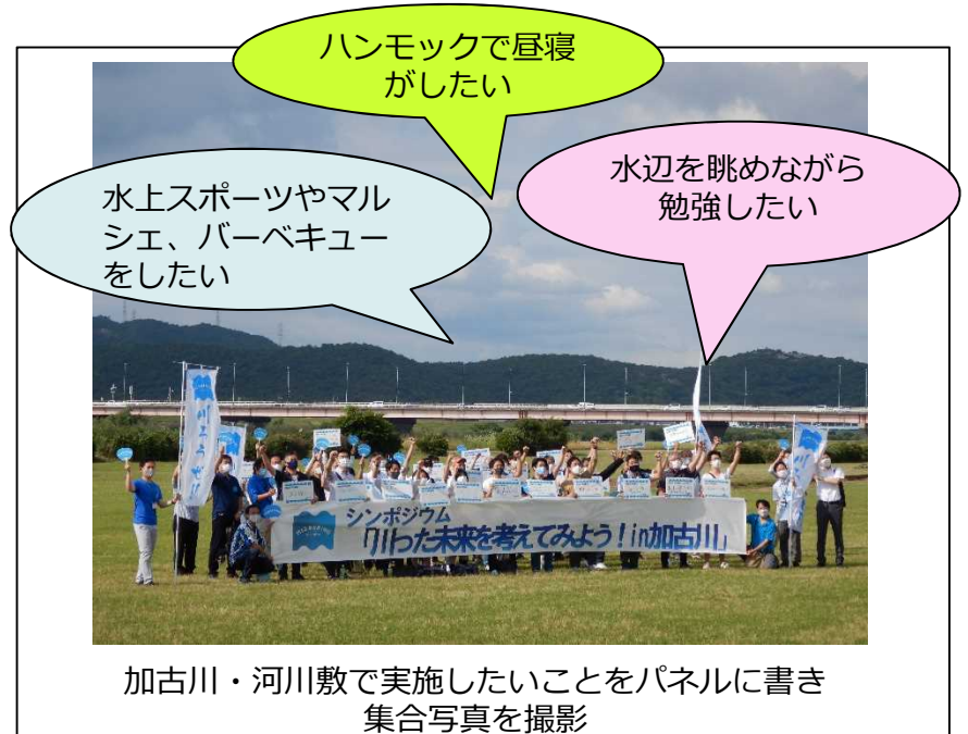
加古川・河川敷で実施したいことをパネルに書き 集合写真を撮影