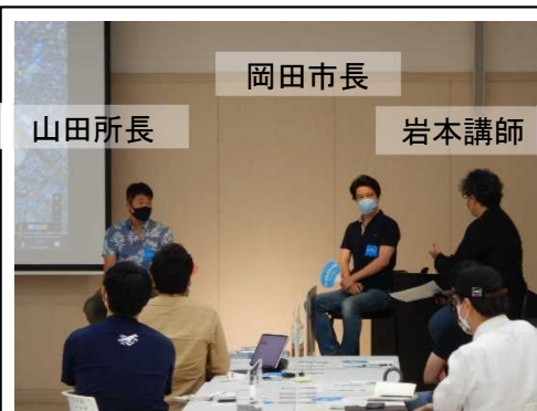
かわトーク実施中