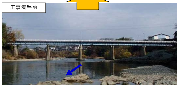
(新)滝見橋 完成イメージ図