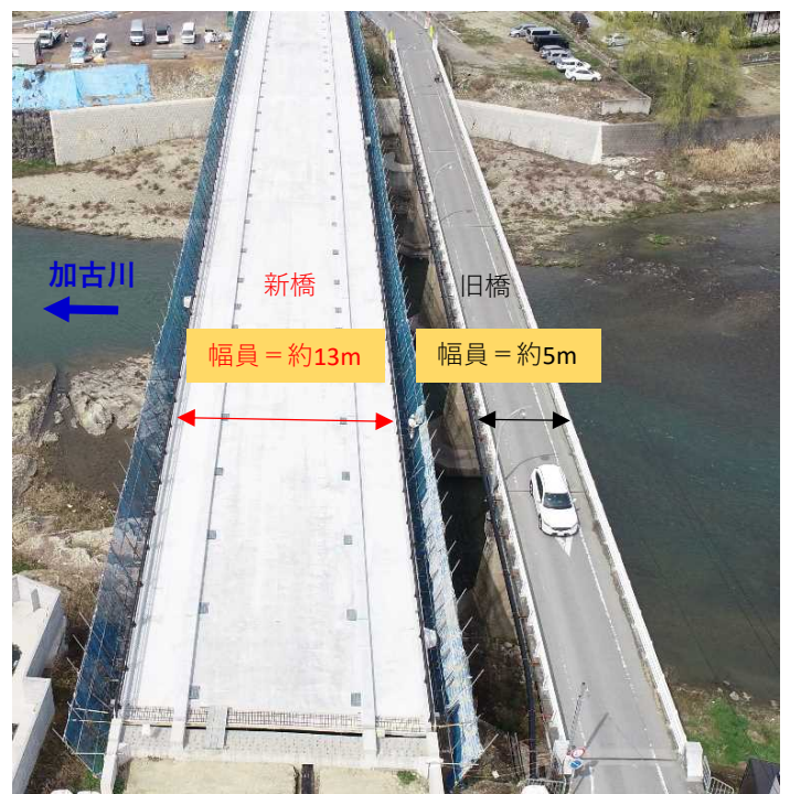
(左側)建設中の(新)滝見橋 (右側)(旧)滝見橋