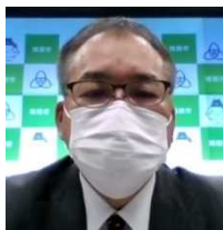
舟引 姫路市 防災審議監 (姫路市長代理)