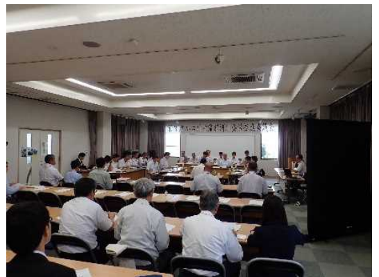
写真 協議会の様子