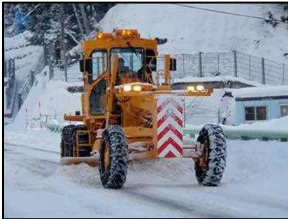
▲除雪グレーダーによる除雪