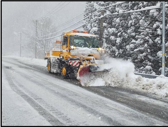
▲除雪トラックによる除雪