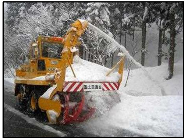
▲ロータリー除雪車による除雪