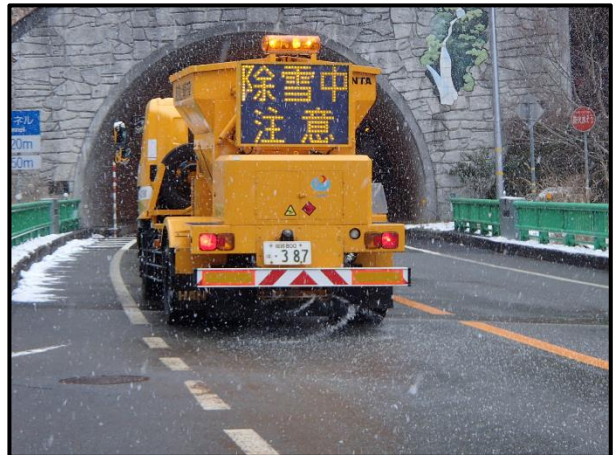
▲凍結防止剤散布車による散布