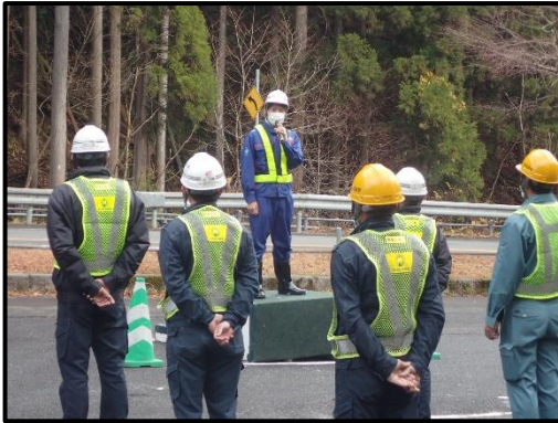
▲除雪作業者への訓示