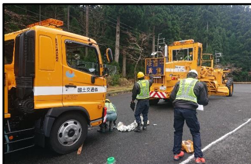
▲牽引訓練の説明会