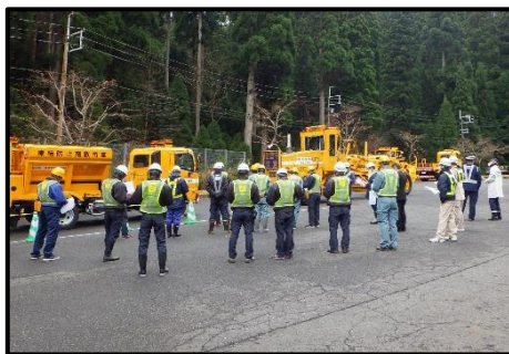
▲牽引訓練の説明会