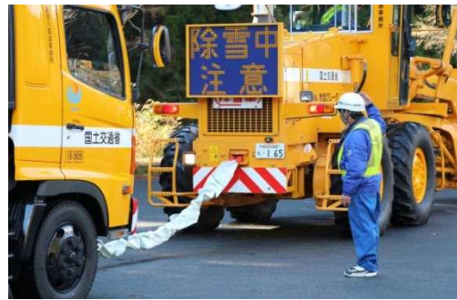
車両に牽引ロープを装着