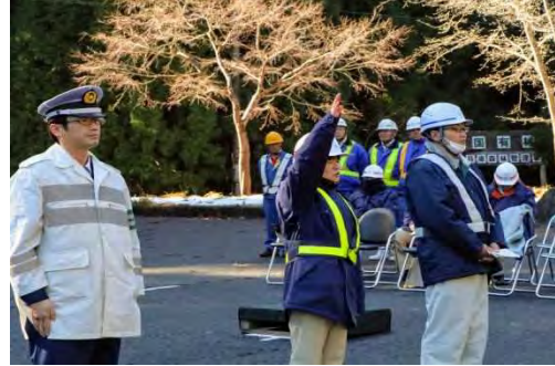
担当者による宣誓