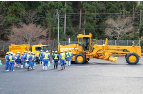
車両移動訓練の説明