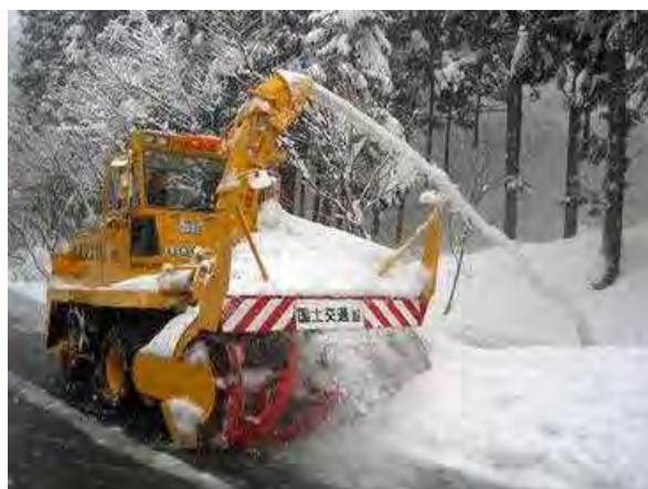
ロータリ除雪車による除雪(前から)