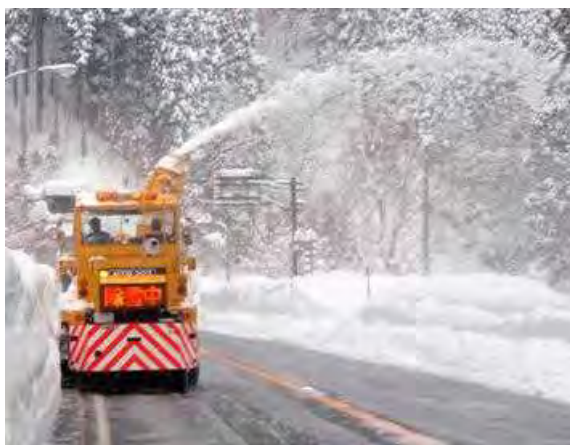
ロータリ除雪車による除雪(後ろから)