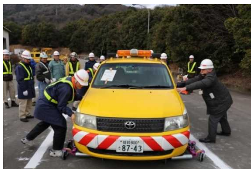
ジャッキ付キャスターの操作訓練