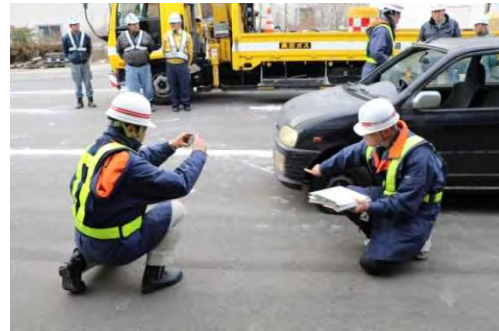
移動車両の写真撮影