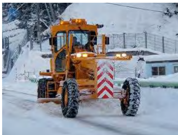
除雪グレーダによる除雪(前から)