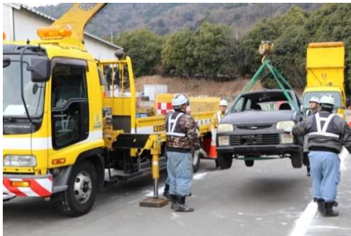
ユニック車での車両吊り上げ訓練