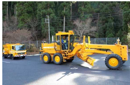
牽引による車両移動の様子