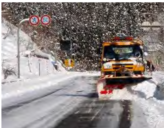
除雪トラックによる除雪(前から)