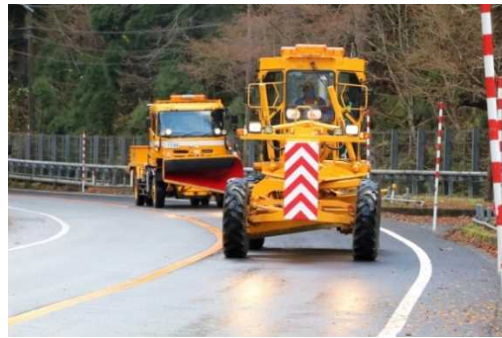
出動する除雪グレーダと除雪トラック