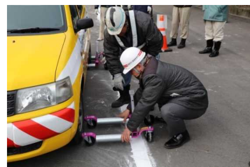
ジャッキ付キャスターでの車両移動訓練