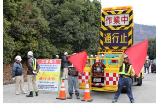
現地看板設置・案内訓練