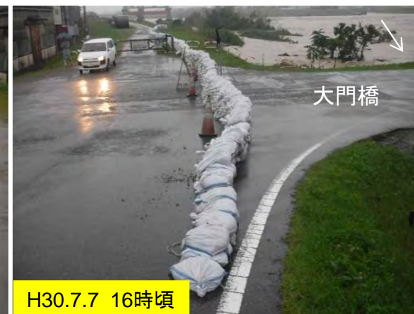
積み土のう工完了