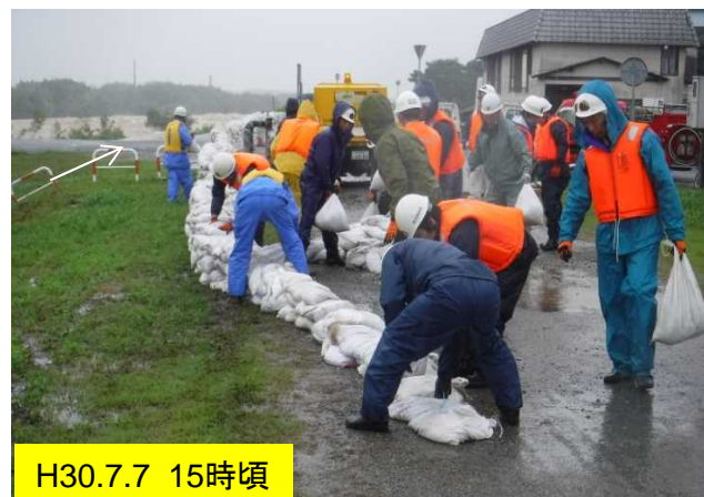
積み土のう工実施状況