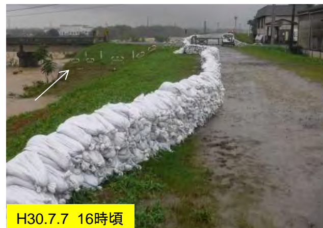
積み土のう工完了