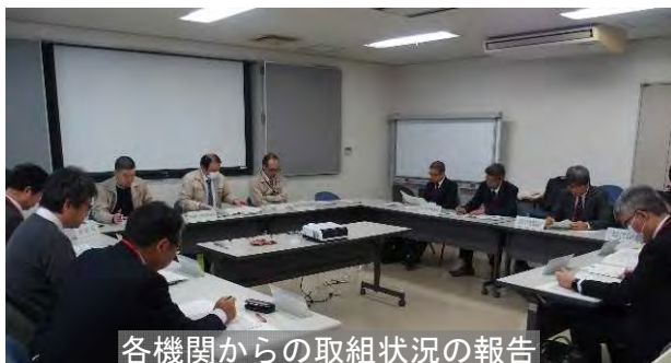
各機関からの取組状況の報告