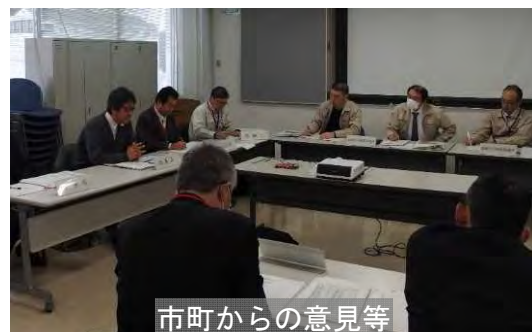
市町からの意見等