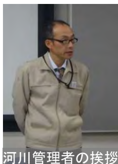
河川管理者の挨拶