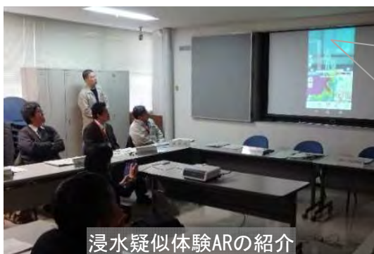
浸水疑似体験ARの紹介