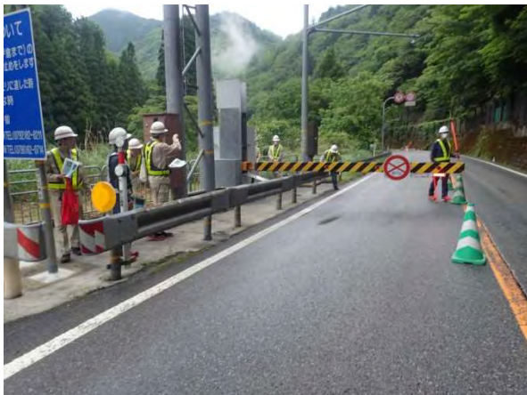
▲通行遮断装置操作実施(通行規制状況)