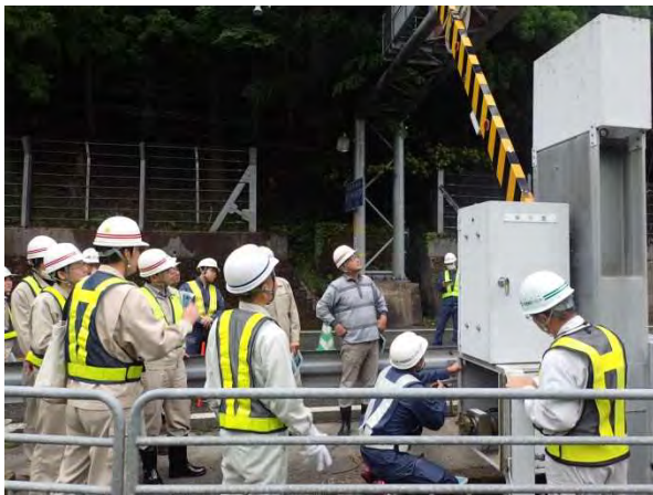
▲遮断装置手動操作状況