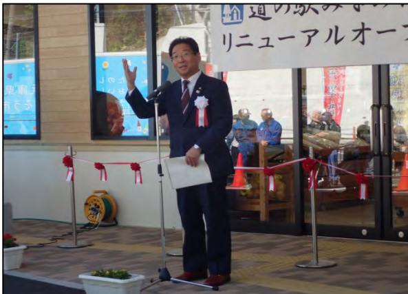
▲福元 晶三 宍粟市長の挨拶