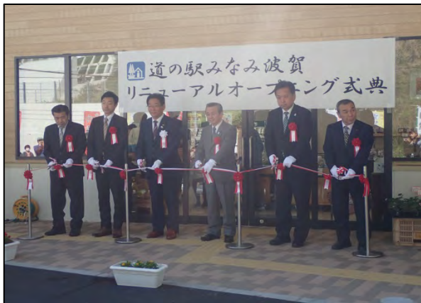
▲テープカットの様相(左から2番目が信田事務所長)