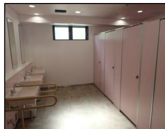
▲改修されたトイレ (更衣室の設置・洋式化)