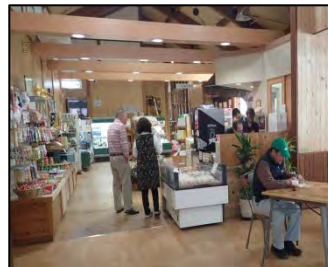
▲改修された直売所(面積140m2 に倍増)