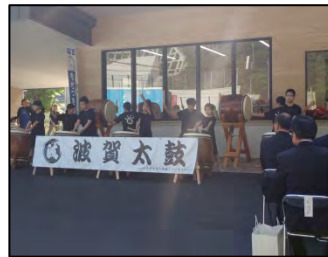
▲波賀太鼓クラブの演奏