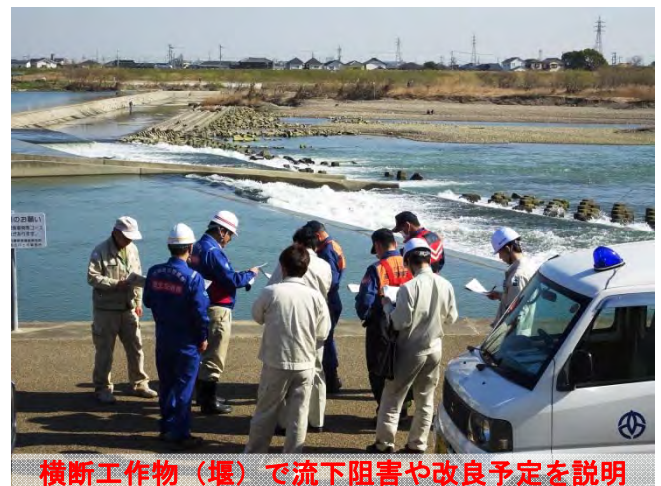
横断工作物（堰）で流下阻害や改良予定を説明