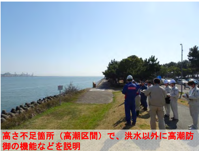
高さ不足箇所（高潮区間）で、洪水以外に高潮防御の機能などを説明