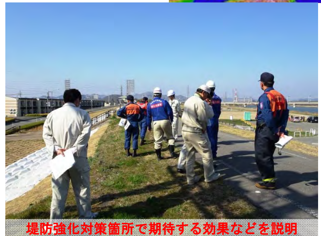
堤防強化対策箇所期待する効果などを説明