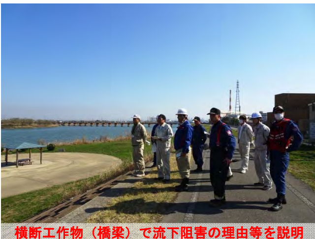
横断工作物（橋梁）で流下阻害の理由等を説明