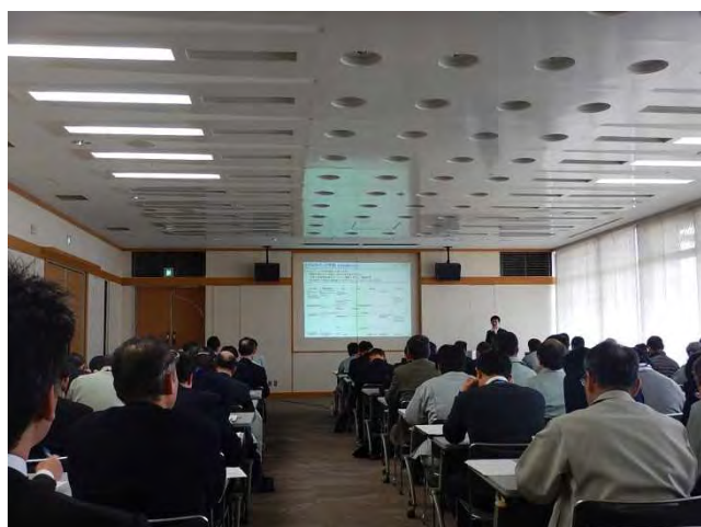
熱心に説明を聞く加古川市職員