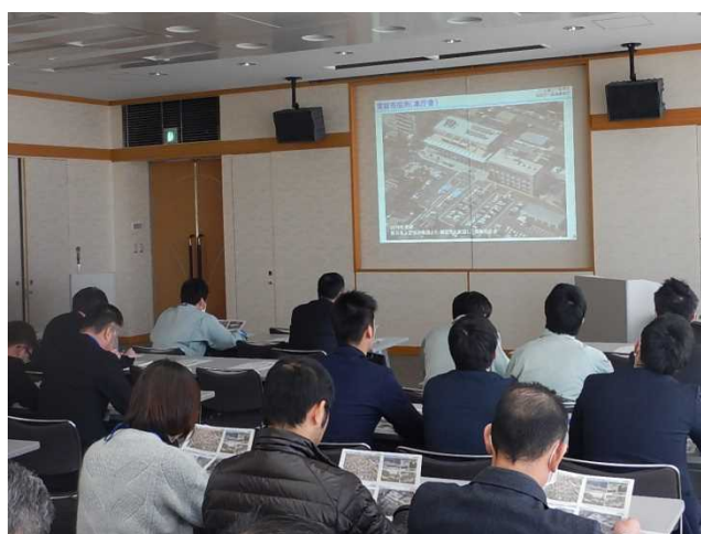
鬼怒川と加古川の類似性についての説明