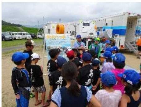
▲対策本部車、排水ポンプ車を展示