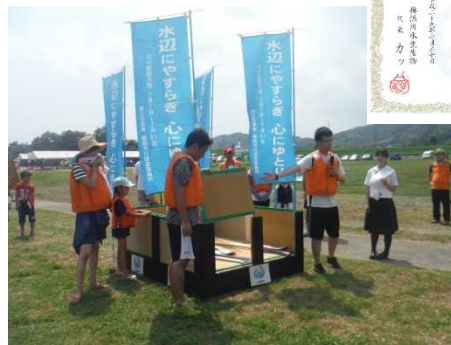
▲“畳堤”をイメージしたいかだで出艇、無事完走し、特別賞を受賞！