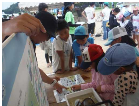
▲会場前で採取した水生生物の説明