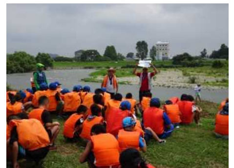
▲鮎の稚魚放流(揖保川漁協)