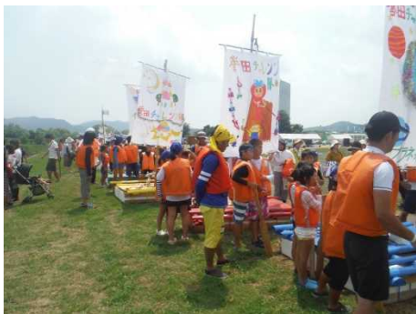
▲20チームが手作りのいかだで参加