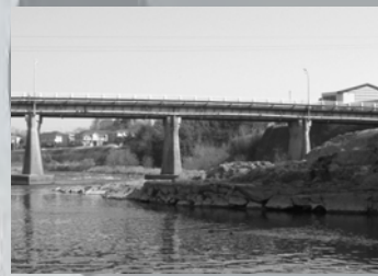
▲新町船着き場跡(加東市新町付近)