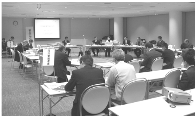
合計49名の方の参加をいただきました。