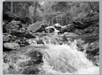
▲加古川上流の風景

このニュースレターは加古川流域委員会の審議内容について、流域の皆様に発信するために、加古川流域委員会が発行しています。加古川流域委員会の内容はホームページでもご覧になれます。