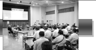
合計47名の方の参加をいただきました。

●委員会の概要 平成21年9月15日に委員12名の参加を得て実施しました。 加古川の河川整備計画に反映させる河川整備の内容についての審議を行いました。