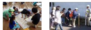
マイ・タイムライン作成 避難経路の確認