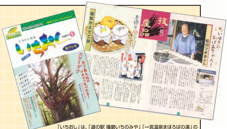
「いちおし」は、「道の駅 播磨いちのみや」「一宮温泉まほろばの湯」の売店などで販売しています(100円)。

一宮町では、地域資源を再発見し、次世代へと伝えていくために「いちおし」という情報誌を平成15年5月に発刊しました。この情報誌の特徴は、テーマごとに編集委員を地域住民から募集し、住民自らが企画し、情報を集め、記事の執筆まで行っているところです。テーマは「地域づくり」「昔の遊び」「技と産品」「自然を歩く」「清流にくらす小鳥」「石造品めぐり」の6つ。現在、編集委員と役場とが協力して第2号を編集中です。