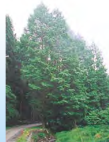
▲メタセコイヤ並木 生ける化石として有名。 スギ科の落葉高木で高さは35mにもなります。