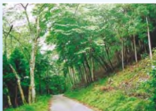
▲ケヤキ並木の中を歩く 日本を代表する広葉樹のひとつ。

揖保川源流部の、阿舎利山 あじり の森を訪ね、植物や動物を調べながら、自然の神秘に触れました。途中でアマゴの産卵に出くわし、貴重な体験をすることができました。