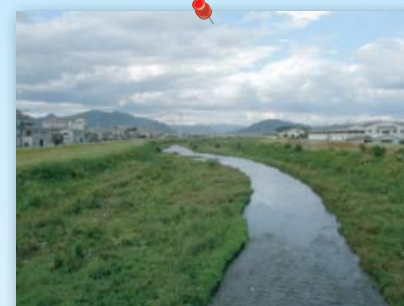
事業後 導水後、流量回復