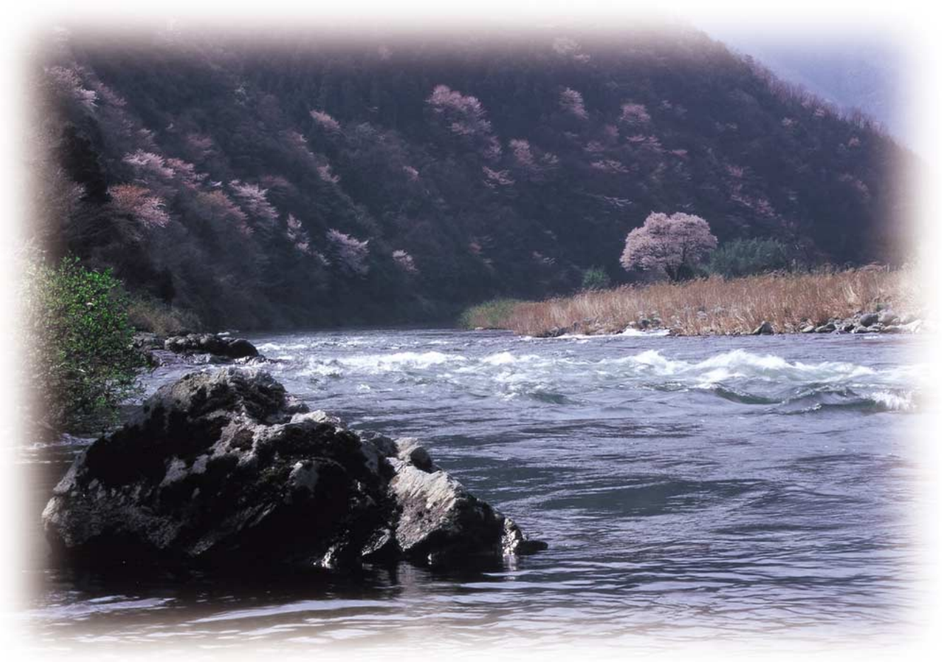
山崎町 杉ヶ瀬付近より