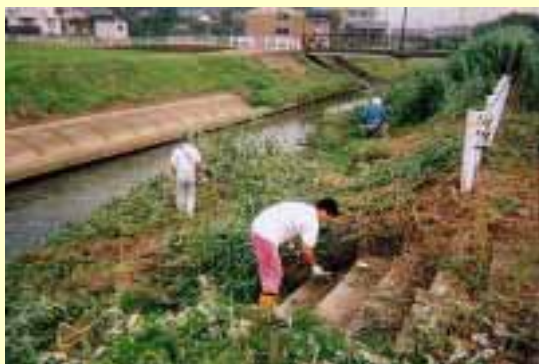
田島川における草刈り、 ゴミの除去活動（丸岡町）