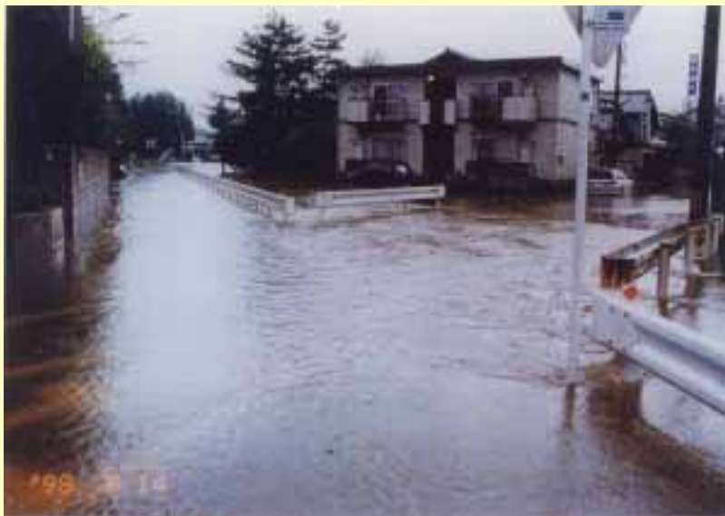
底喰川流域（福井市町屋付近） 平成10年8月14日 出水