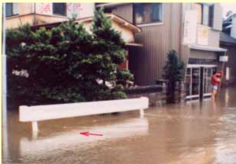
馬渡川流域（福井市経田付近） 昭和56年7月3日 出水