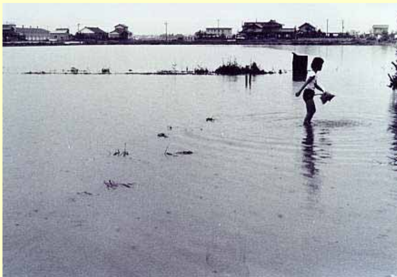
八ヶ川流域（福井市川合鷺塚付近） 昭和56年7月3日 出水