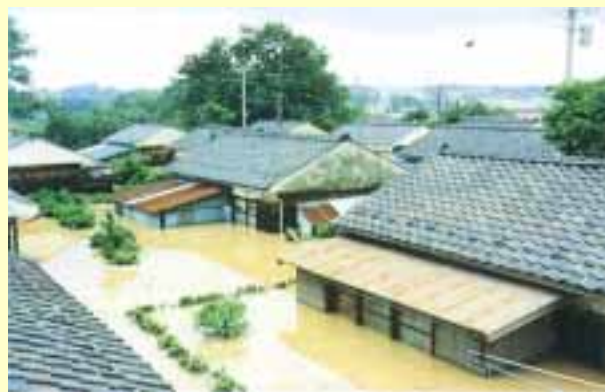
竹田川流域（あわら市春宮1丁目付近） 昭和56年7月3日 出水