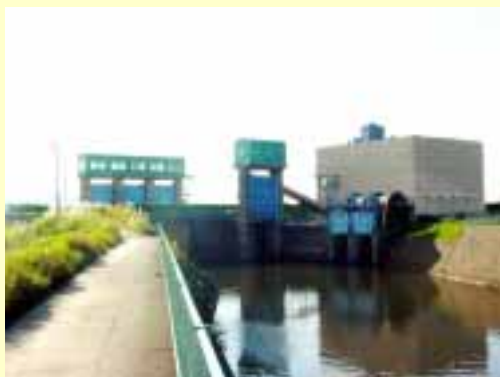
磯部川樋門と排水機場