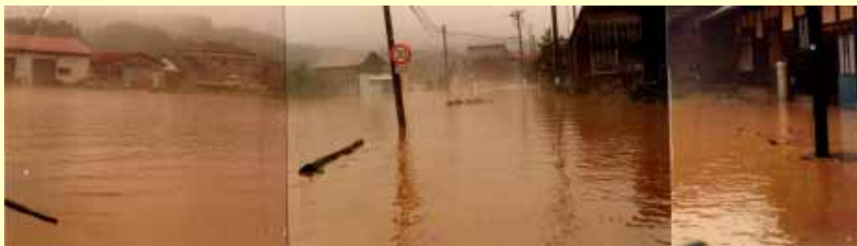
七瀬川流域（福井市大年町付近） 昭和56年7月3日 出水