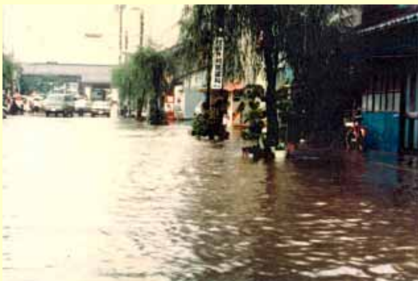
磯部川流域（春江町JR春江駅前付近） 平成2年9月20日 出水