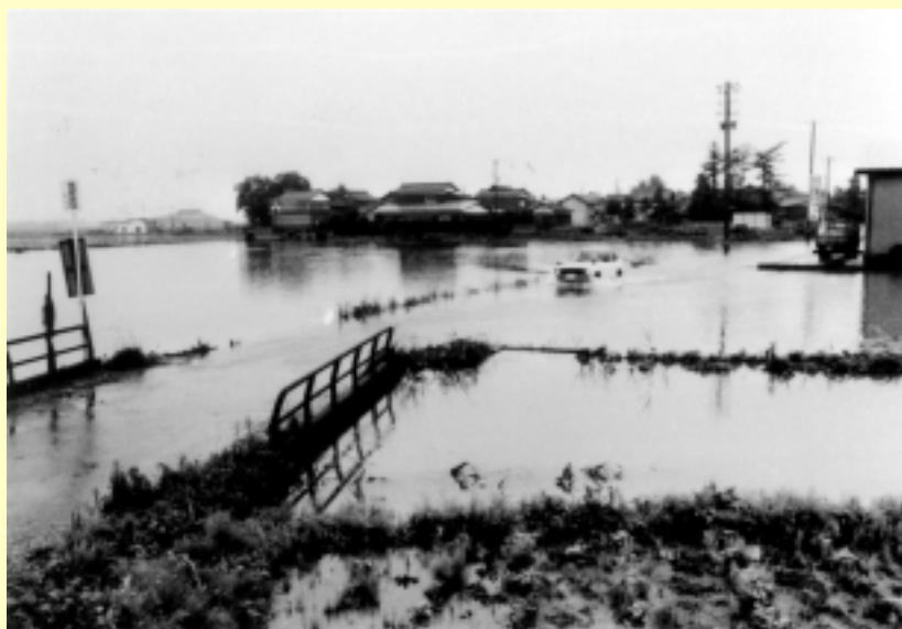
北川流域（福井市川合鷺塚付近） 昭和56年7月3日 出水