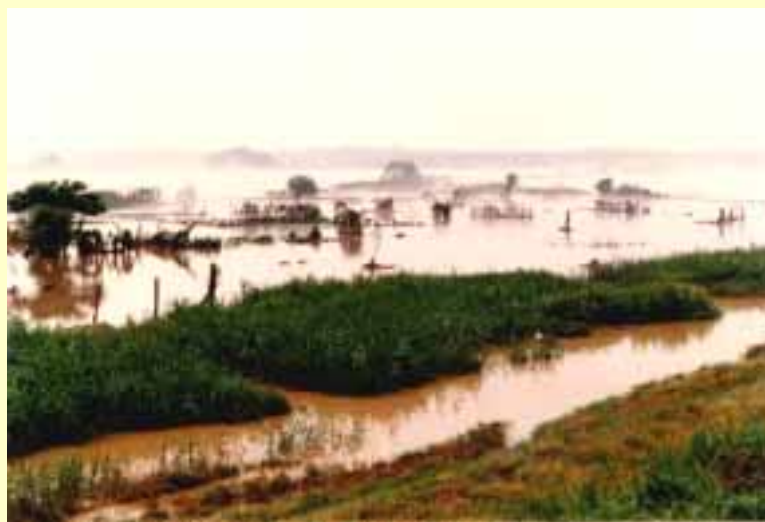
兵庫川流域（坂井町今井付近） 昭和56年7月3日 出水