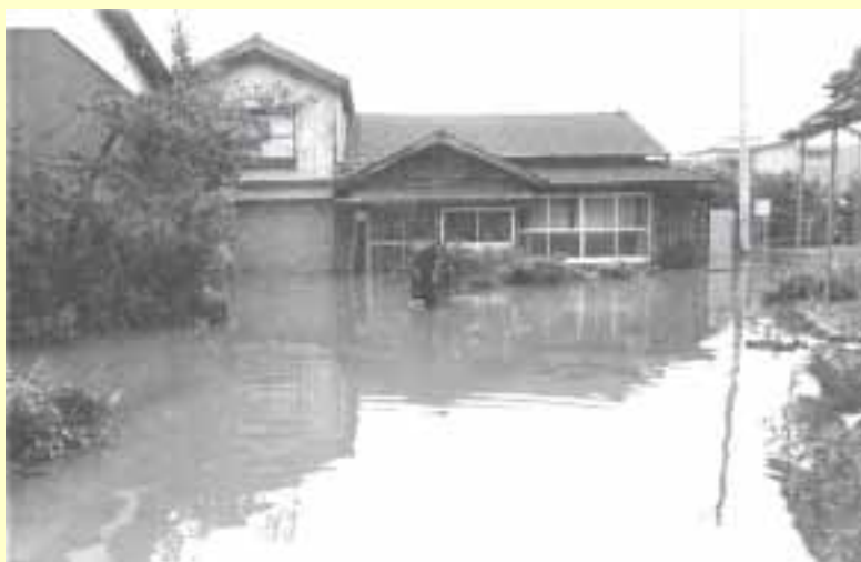
芳野川流域（福井市森田付近） 昭和56年7月3日 出水