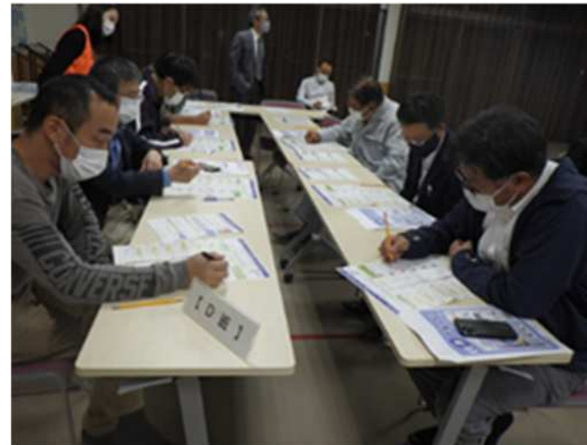
【マイ・タイムラインワークショップ】 R3. 10. 20 福井市中藤島地区 40名