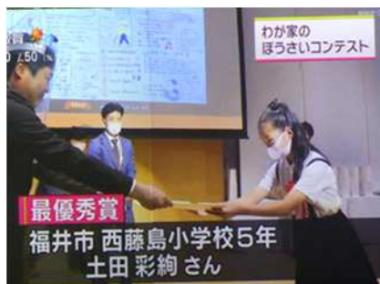
第8回表彰式の様子