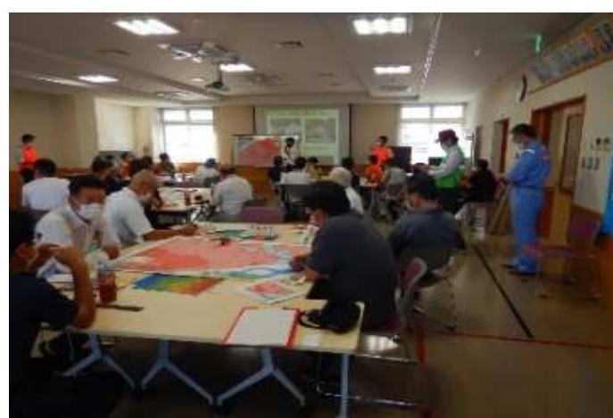
【マイ防災マップワークショップ】