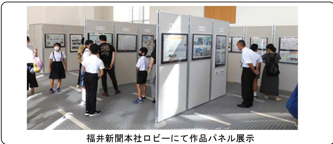
福井新聞本社ロビーにて作品パネル展示