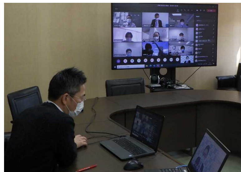
九頭竜川流域における担当者会議の実施状況(左:第2回、右:第3回)