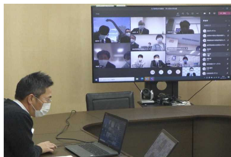
北川流域における担当者会議の実施状況（左：第2回、右：第3回）