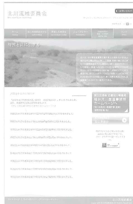
北川流域委員会 ニュース No.9 平成22年1月発行

北川流域委員会ホームページ http://www.kita-river.org/