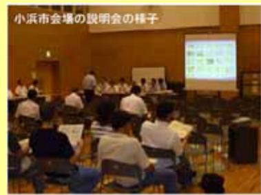
住民説明会(小浜市)