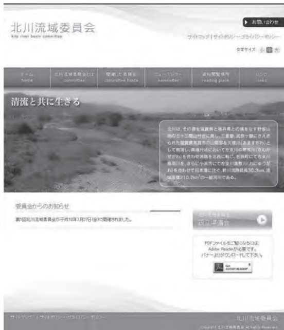
北川流域委員会 ニュース No.1 平成19年8月発行

北川流域委員会ホームページ http://www.kita-river.org/