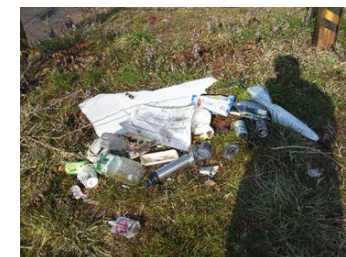
北川に捨てられたゴミ