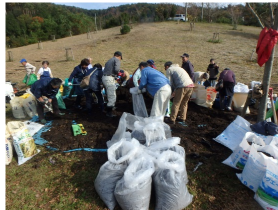
堆肥の無償提供状況