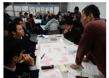
↑グループワークの様子