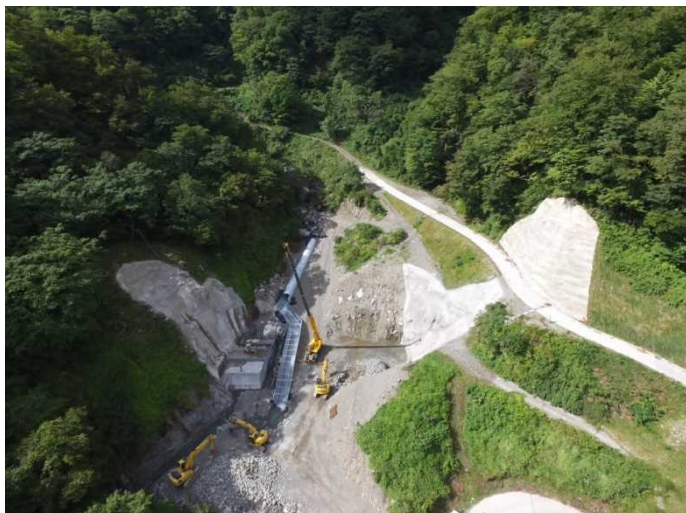
堰堤右岸部の施工状況