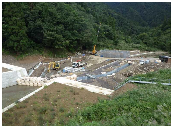
流路（大型ブロック積）の施工状況