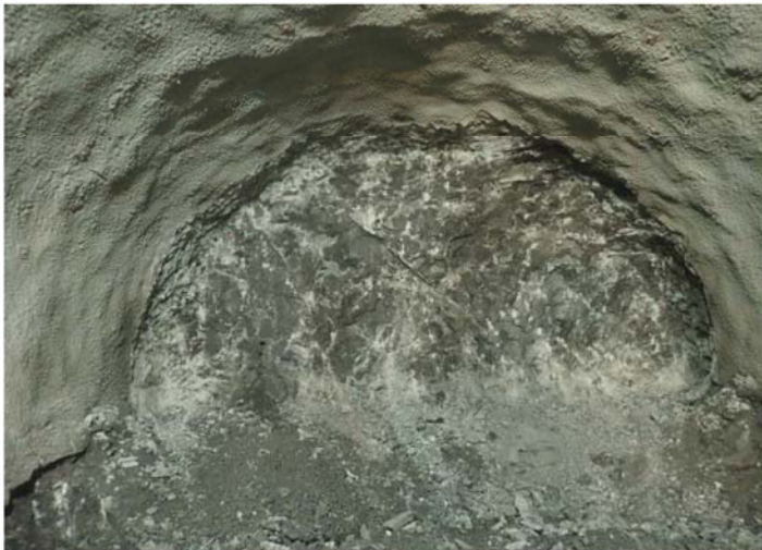
※冠山峠2号トンネル（仮称）は、平成26年6月30日、掘削に着手しました。