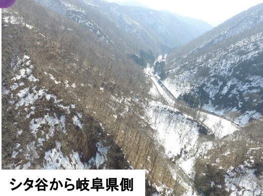
シタ谷から岐阜県側