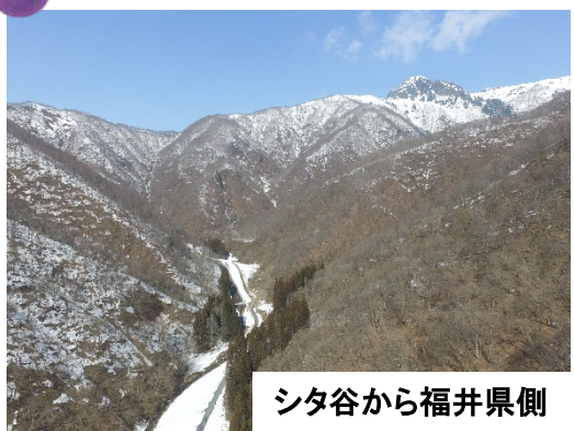
シタ谷から福井県側