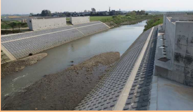
定点写真-2 熊坂川橋