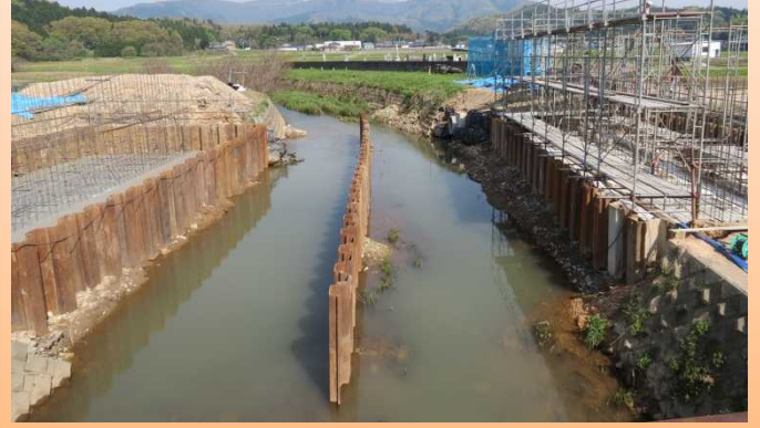
写真-3:熊坂川橋東側