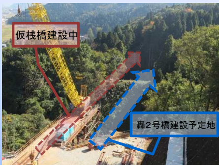
写真-4 急峻な地形に橋梁を架設するため、仮栈橋を作る工事を行っています。

・約20mのグラウンドアンカーを地中部に埋め込むために機械で穴を掘削しています。